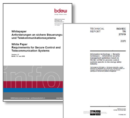
Abbildung 1: BDEW Whitepaper, ISO/IEC 27019