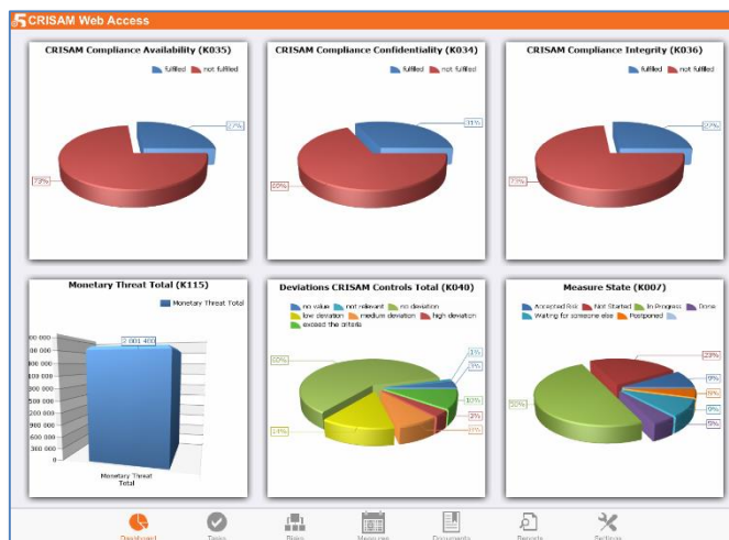
Abbildung 2: CRISAM® iOS App

CRISAM® Web Access, 50 Named User LTU CRISAM® Web Access, 500 Named User LTU CRISAM® Web Access, Unlimited Named User LTU